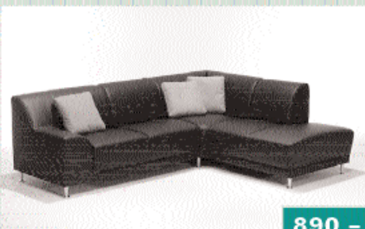
Polstergruppe Mod. MEPHISTO, Textil-Leder blau, best.: Element 2-plätzig, Ottomane, inkl. Küssensatz 3-tlg. blau.