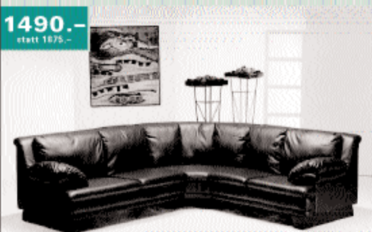
Polstergruppe Mod. CARLOS, Textil-Leder blau, best.: Element 3-plätzig, Rundecke, Element 2-plätzig.